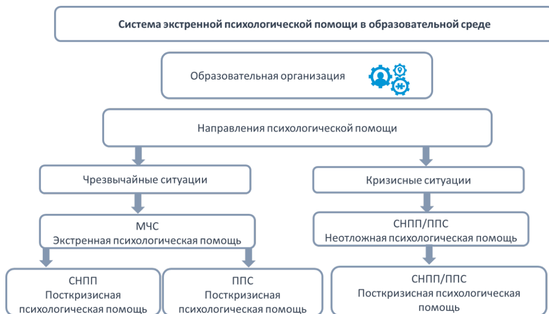
Рисунок 1. Система экстренной психологической помощи в образовательной среде (СЭППОС).