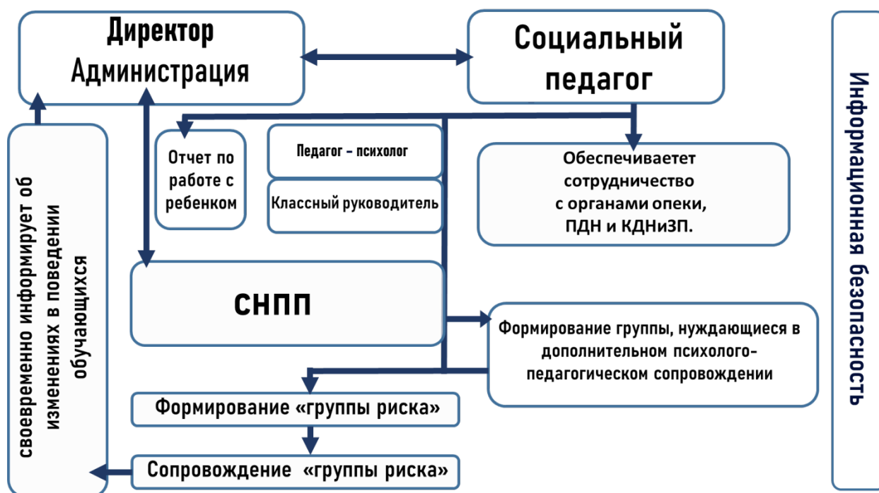
Рисунок 7. Алгоритм действий социального педагога в кризисной ситуации

1. При получении информации от администрации о факте произошедшего действует в соответствии с поручениями администрации. В случае получения информации о кризисном событии из других источников, по возможности, уточняет обстоятельства случившегося. В письменной форме информирует администрацию образовательной организации и действует в соответствии с антикризисным планом.