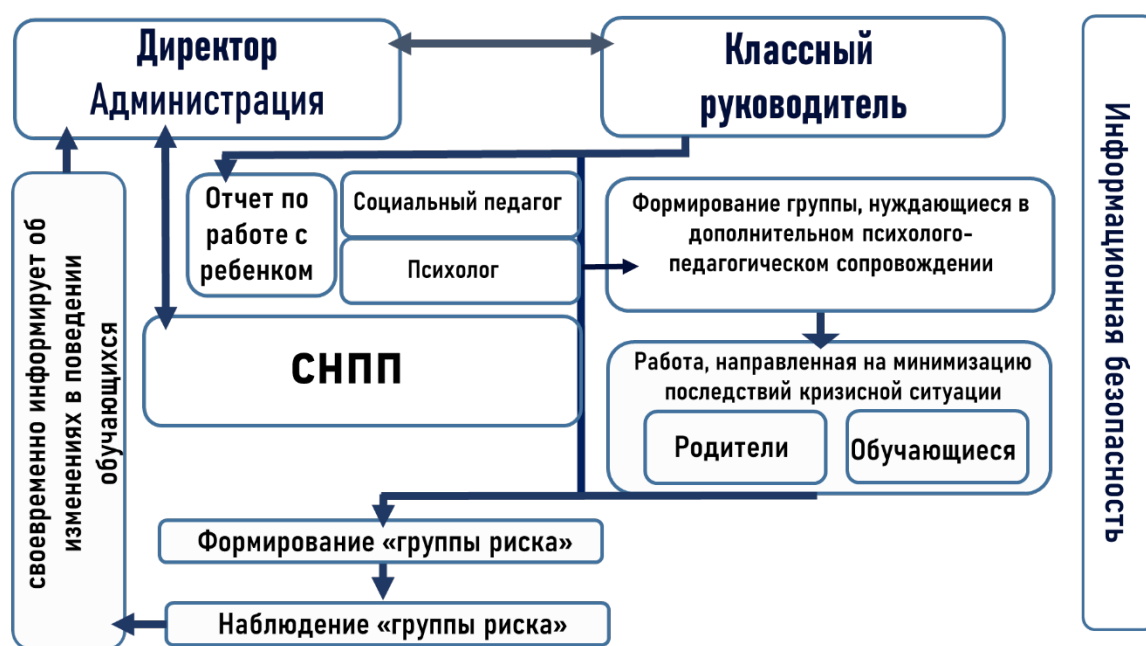
Рисунок 5. Действия классного руководителя в кризисной ситуации.

1. В случае получения информации о кризисном событии, по возможности, уточняет обстоятельства случившегося. В письменной форме информирует администрацию образовательной организации.