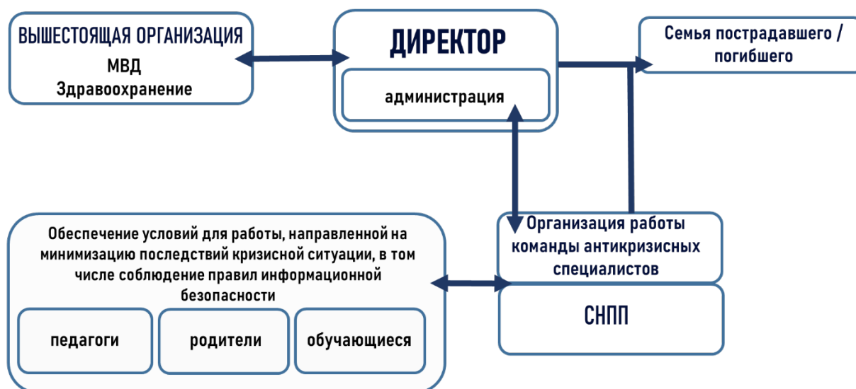
Рисунок 4. Алгоритм действий администрации образовательной организации.

1. Уточняет обстоятельства произошедшего. Оповещает вышестоящую организацию региона/города/района о факте случившегося в соответствии с установленным порядком. При необходимости, обеспечивает сотрудничество с органами внутренних дел, здравоохранения и социальной защиты.