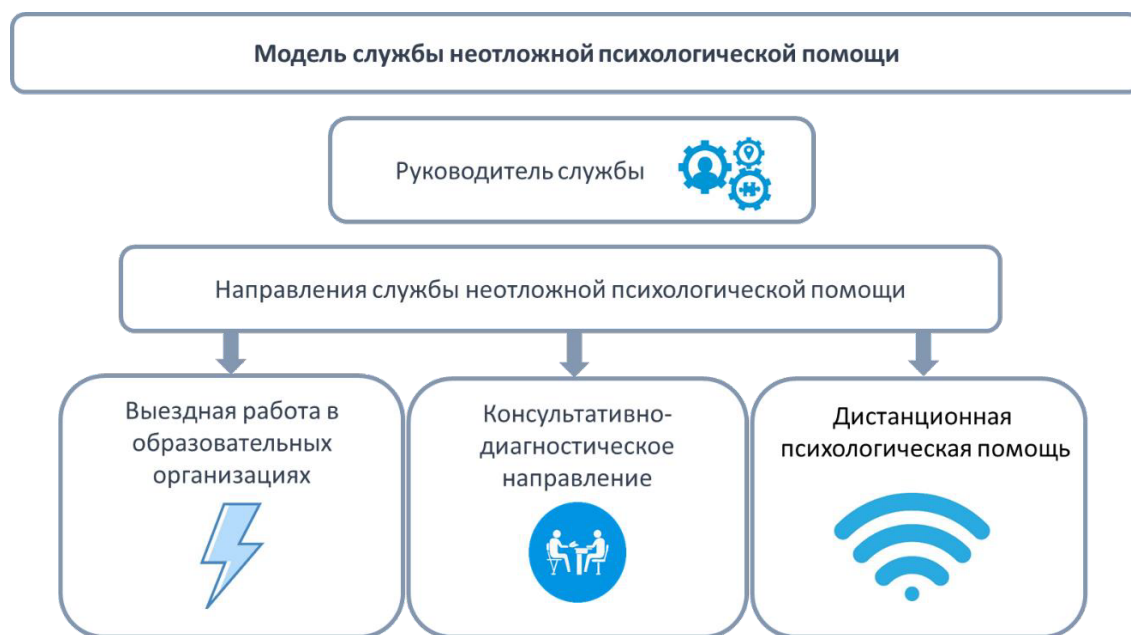
Рисунок 2. Модель Службы Неотложной Психологической Помощи.

компетенций), так и внешними специалистами Службы Неотложной Психологической Помощи. Опыт оказания неотложной психологической помощи показывает эффективность такой помощи именно внешними специалистами, так как в этом случае специалист-психолог не входит в первый круг пострадавших.